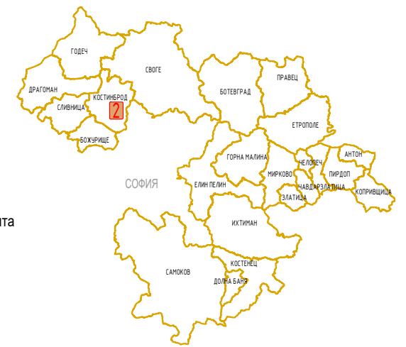
СХЕМА / SCHEME: