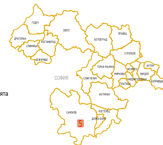
СХЕМА / SCHEME: