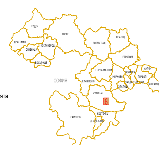
СХЕМА / SCHEME: