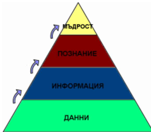
Фиг. 2 DIKW йерархия

Отделните нива в йерархията според Ascoff се дефинират по следния начин: