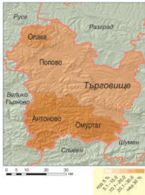
Фиг. 1. Пример за картографска визуализация на равнището на безработицата на областно ниво

□ Анализ на инфраструктурната обеспеченост. Тук се включва анализ на транспортната, водоснабдителната, канализационната, електроснабдителната, съобщителната и екологичната инфраструктура, обслужваща както населението, така и бизнеса в областта. Последователно се анализират основните компоненти на транспортната инфраструктура, като акцентът следва да се постави върху настъпилите промени в нейните параметри, включително оценка на това доколко през изминалия период на действие на стратегията се е променила ситуацията по отношение на обезпечеността с инфраструктурни системи и как това се е отразило върху развитието на областта. За оценка на вътрешнообластните диспаритети може да бъде използван показателят “транспортна достъпност на населението до обществени услуги (административни, образователни, културни, здравни и др.) в областния център” (фиг. 2). Определянето на „добрата” транспортна достъпност и съответният приемлив времеви диапазон, обаче, се обуславят от заложените цели на анализа: например, време за достъп до най-близкото болнично заведение, време за достъп до работното място, време за достъп до съответния областен център и пр.