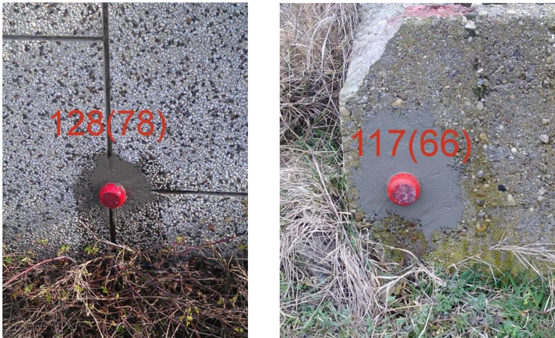
Фигура 5. Стабилизиране на болтове в сгради и съоръжения

Фигура 5 показва стенни болтове, стабилизирани в сграда и съоръжение.