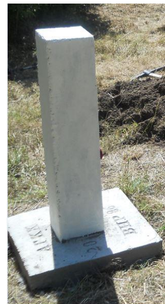
Фигура 3. Изработване на бетонов стълб на показалец към ВНР I и II степен