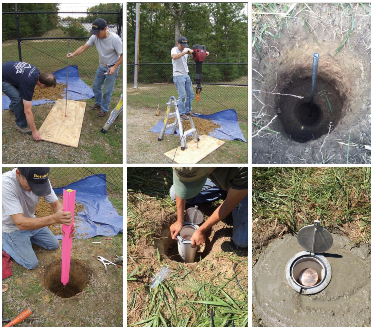
Фигура 2. Етапи от изграждане на дълбочинен репер

Етапи от изграждане на дълбочинен репер са дадени на фигура 2.