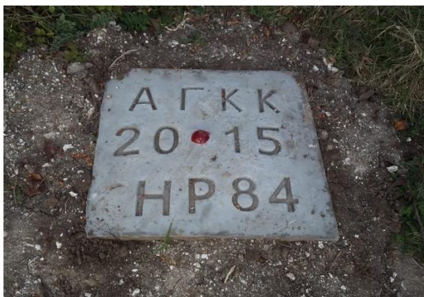
Фигура 8. Стабилизиран гъбовиден болт на терен