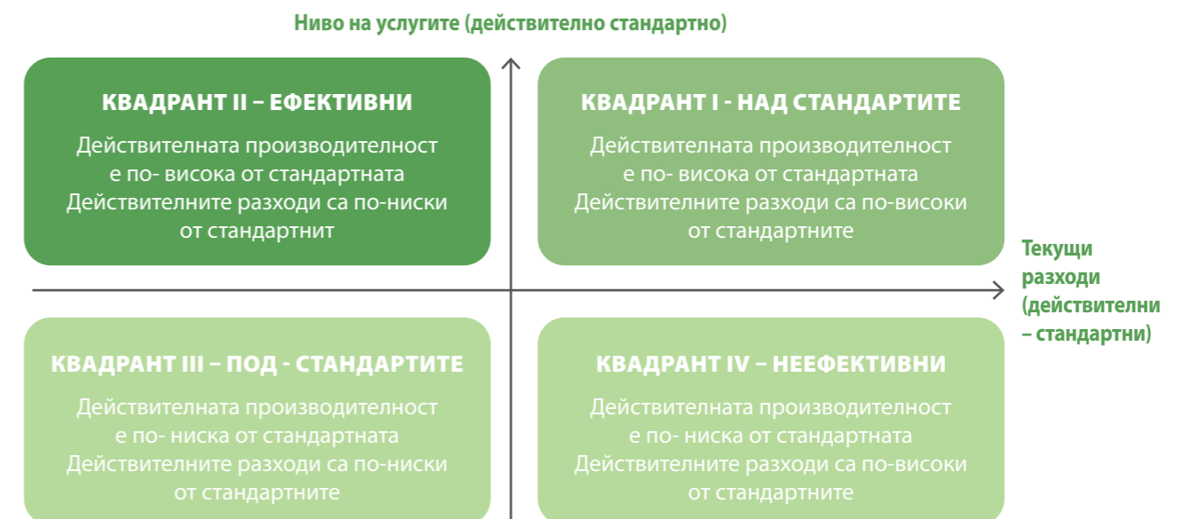
Графика 2. Анализ на ефективността

Следователно оценката на ефективността би могла да се основава на съвместния анализ на два показателя: разликата в разходите (разликата между действителните разходи и СРП) и разликата в резултатите (разликата между действителните резултати и СП). Този съвместен анализ може да се извърши чрез представяне на всяка местна администрация в графика от четири квадранта като тази, представена в Графика 2.